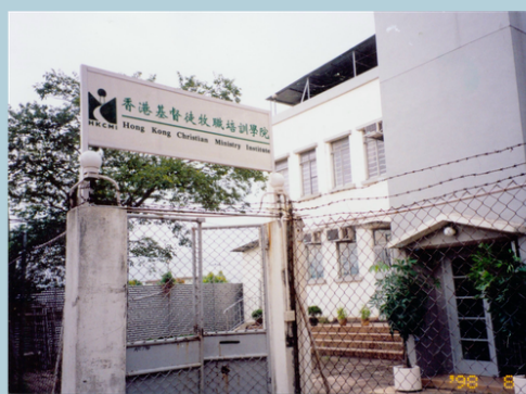
遷入第二院舍：牛潭尾