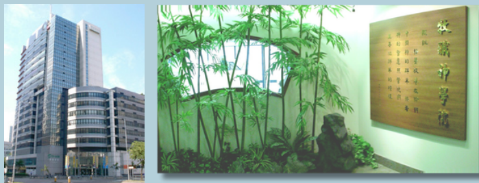
遷至現時校舍都會廣場七樓

隨後，學院遷至都會廣場，購置物業的過程亦是信心的考驗。因資金不足，原計劃購買整層的方案最終改為與香港短宣中心及小瀝源平安福音堂共同購置。都會廣場環境大幅改善，免除了蚊患與交通不便之苦，讓師生能更專心神學裝備上。